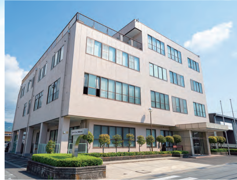
本社事務・技術棟