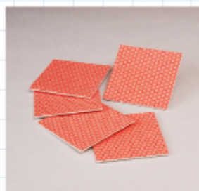
研磨シート(標準タイプ)