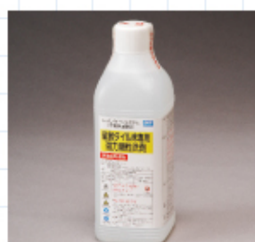
磁器タイル用洗剤