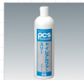
トイレアルファ・スリー