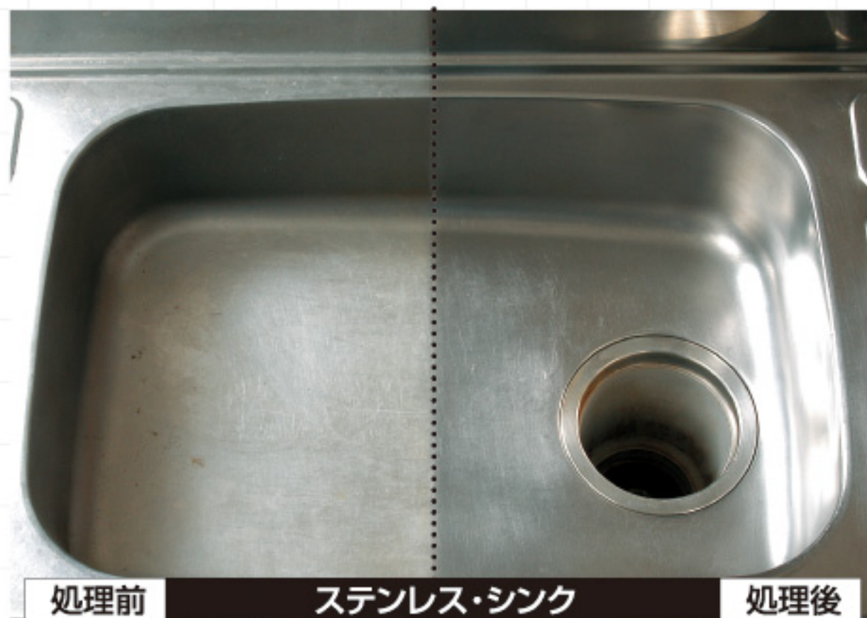
処理前 ステンレス・シンク 処理後